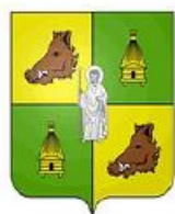
Ville de Cestas